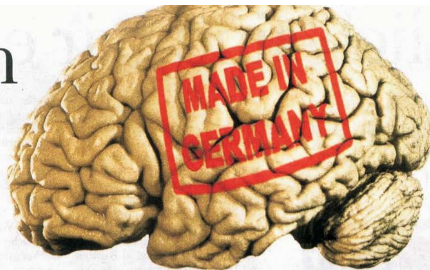
Exodus der Intelligenz: 1500 deutsche Forscher gehen jährlich in die USA

Der deutsche Nobelpreis für Physik ist kein Grund sich zurückzulehnen, finden junge Forscher. Sie fordern Reformen